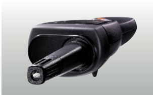
testo 625 프로브 핸들 부착